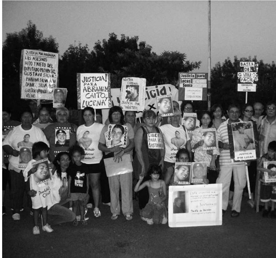
Madres y familiares del genocidio en democracia.

siguiendo su ejemplo, las madres de las víctimas del genocidio en democracia: el gatillo fácil, la violencia institucional, la inseguridad, la trata, la droga y la corrupción, se sobreponen a diario al miedo y al dolor individual, rechazando ofertas para comprar su bandera, y en la total inexperiencia política abandonan el terreno doméstico para ganar las calles, foto en pecho y pancarta en mano, superando el abandono del Estado, uniéndose en el dolor y en la valentía, buscándose en la soledad y la lucha, para encarar, de una vez y para siempre, el camino de la pelea por justicia por los hijos de todas, por los que estuvieron, por los que están y por los que siempre estarán.