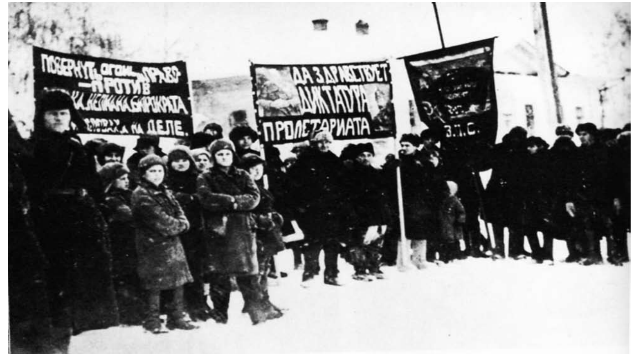
Foto: Manifestación de deportados en Yenisei, el 7 de noviembre de 1928: “Abajo los kulaks, y la burocracia”, “Viva la dictadura del proletariado”.

Pero esta “teoría” tenía sus consecuencias prácticas. Apoyándose en ella se inició una lucha despiadada con-